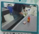
平台沟槽A面直线度研磨