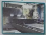
大理石平台粗加工